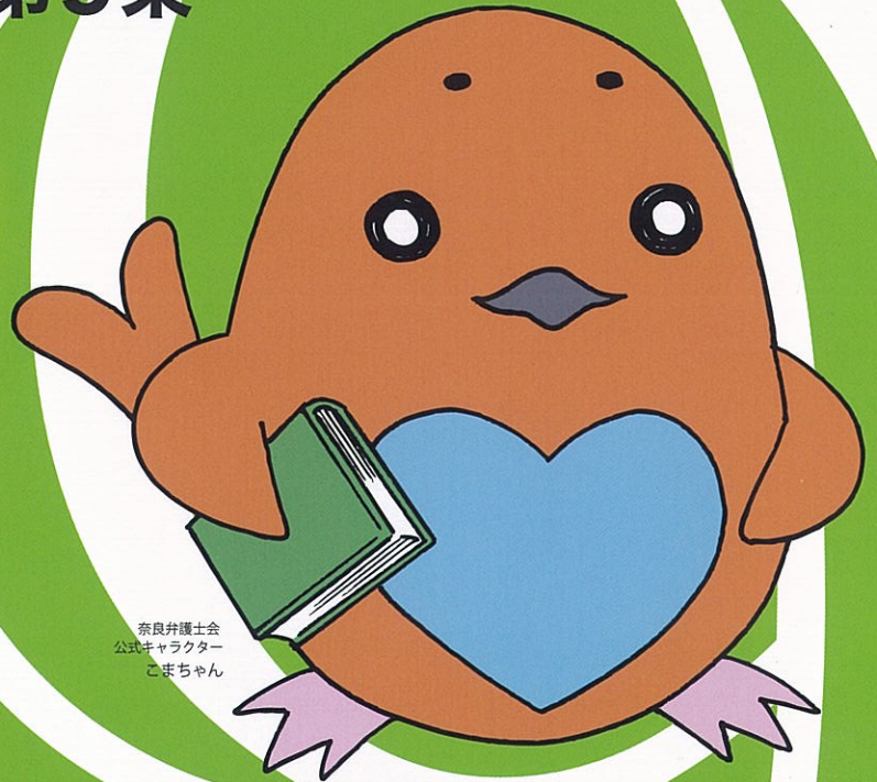
奈良弁護士会 公式キャラクター こまちゃん